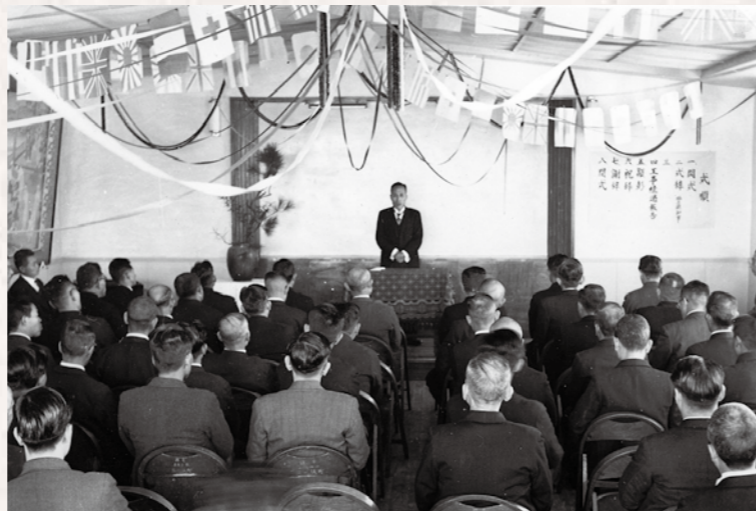
昭和27年1月の勝山病院本館落成