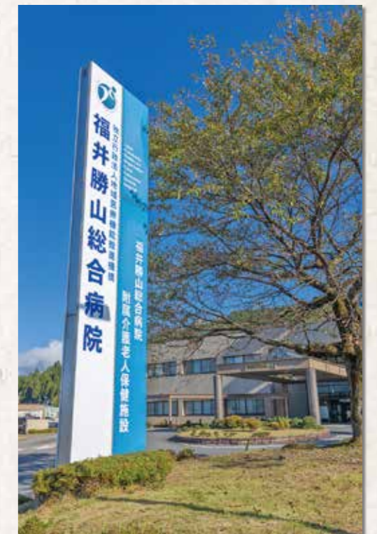
平成26年のJCHO発足時の写真です。