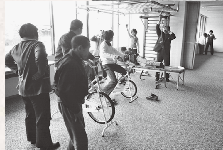
昭和52年のリハビリの様子です。