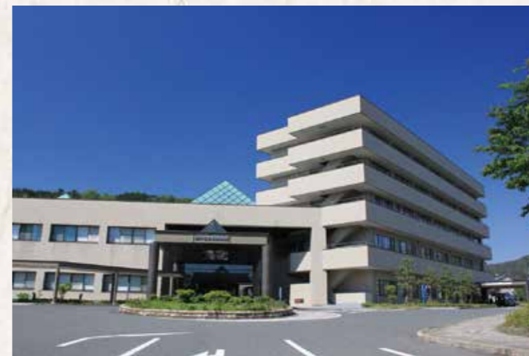
平成11年の現病院移転直後の写真です。