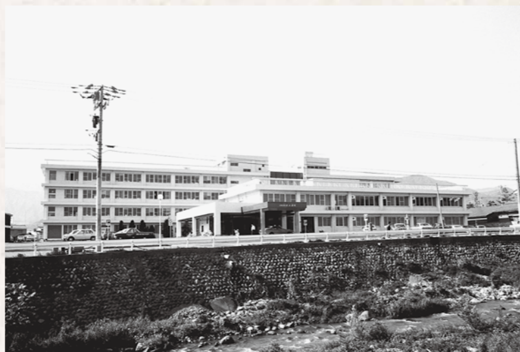
昭和52年の旧病院の様子です。