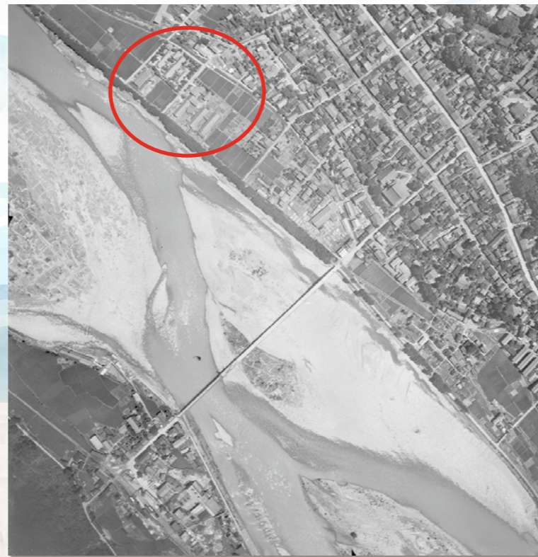
昭和22年11月の航空写真です。 旧々病院の病棟群が確認できます。