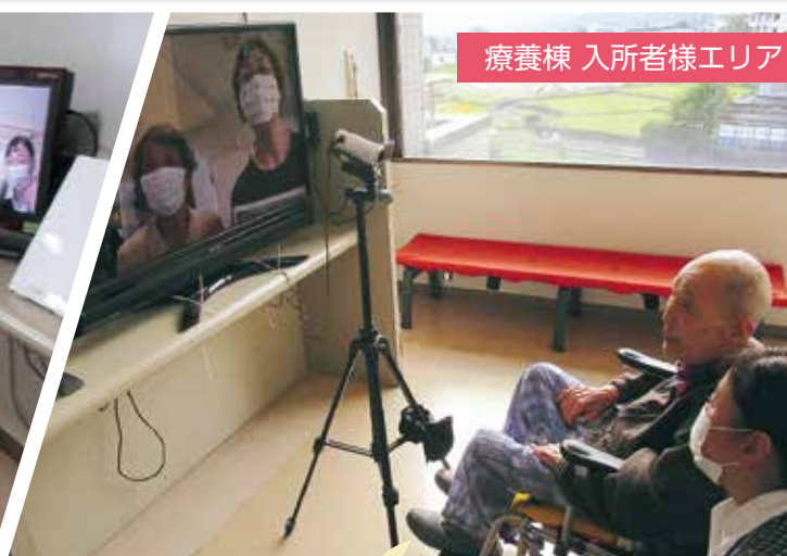
療養棟 入所者様エリア